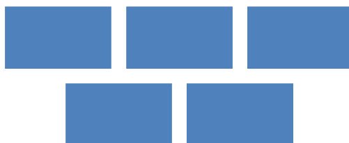
Рис. 1. Схема структуры

♦ В отчете можно использовать иллюстрации. Содержание иллюстраций должно быть понятно читателю без обращения к тексту работы. Иллюстрации (рисунки, графики, схемы, диаграммы) нумеруются арабскими цифрами сквозной нумерацией отдельно по каждому виду иллюстраций. На весь приведенный иллюстративный материал должны быть ссылки в тексте работы следующего вида: «...в соответствии с рисунком 2» или «как показано на рисунке 3» и т.п. Наименование рисунков, графиков и схем располагается по центру, под иллюстрацией.